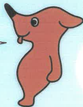
千葉県マスコットキャラクター チーバくん